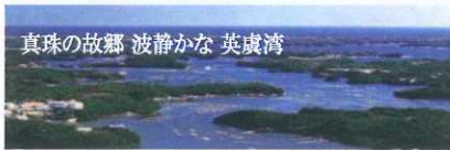
真珠の故郷 波静かな 英虞湾

◆弘法大師ゆかりの志摩のパワースポット 『爪切不動尊』 お大師さまが爪で彫ったとされる 絶対秘仏「爪切不動尊」