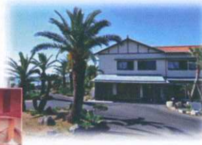
太平洋が目の前 南国情緒豊かなひろはま荘