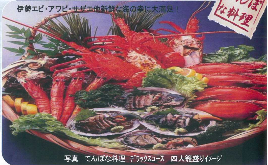
写真 てんぼな料理 デラックスコース 四人籠盛りイメージ